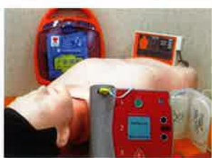
講習普及用資機材

救援物資 毛布(1枚)…………… ¥1,300 安眠セット(1人分)…………… ¥2,000 緊急セット(1世帯4人分) …… ¥3,000