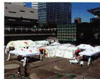
さいたま市で行われた九都県市合同防災訓練の写真