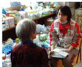
熊本地震災害救護活動で診察するさいたま赤十字病院の医療救護班