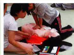
救急法講習の様子

埼玉県内で、512校(幼稚園、保育園を含む)が青少年赤十字加盟校として、活動をしています。