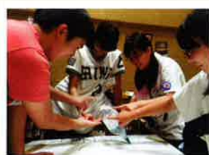
青少年赤十字専業活動

訓練用的人形(1体)…………… ¥151,000 AED(訓練用1台)…………… ¥89,000