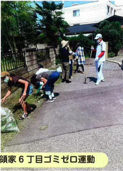
領家6丁目ゴミゼロ運動