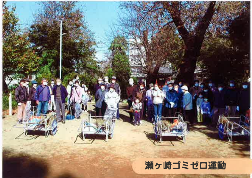
瀬ヶ崎ゴミゼロ運動