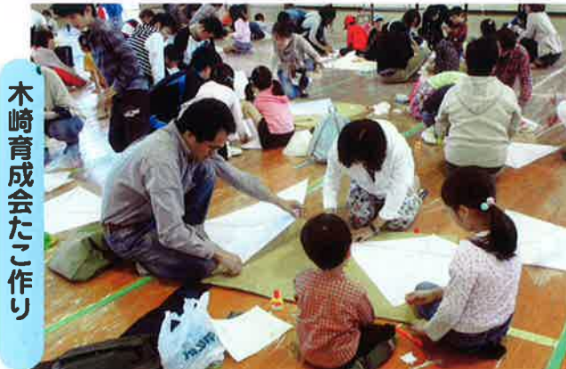
木崎育成会たこ作り