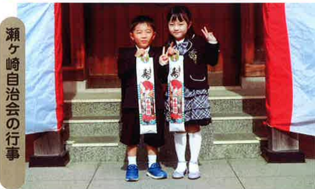
瀬ヶ崎自治会の行事