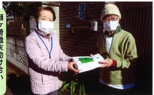
瀬ヶ崎歳末助け合い