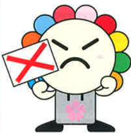
さいたま市選挙キャラクター みらいくん