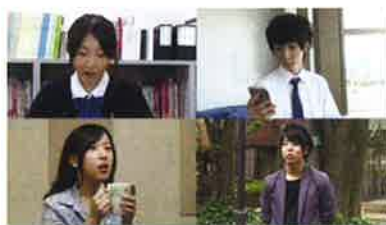
② 「はじめての選挙 ～投票って意外とカンタン!～」