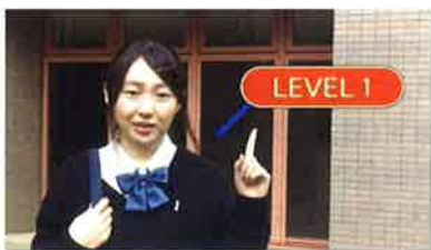
① 「Level up! あなたも素敵な大人に!」