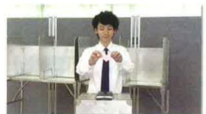
③ 「私たちの願いを託す一票 ～届けようあなたの声～」