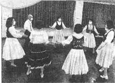
輪になって踊れば、気持ちはひとつ