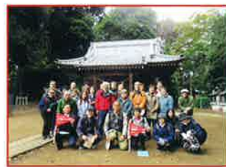
ウォーキングイベント