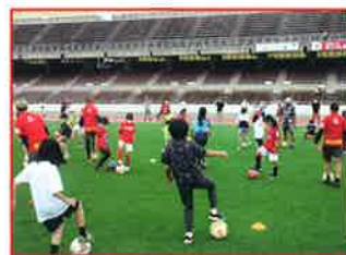
女子サッカー教室