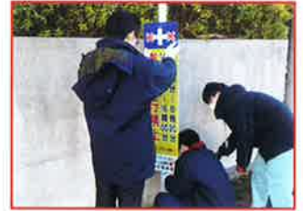
未来(みら)くるワーク体験

目標 アンケートで「仕事をすることは人の役に立つことだと思う」の割合増加数 12.8ポイント