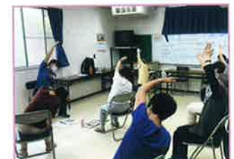
ますます元気教室