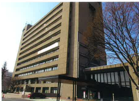
祝 浦和区役所 20周年