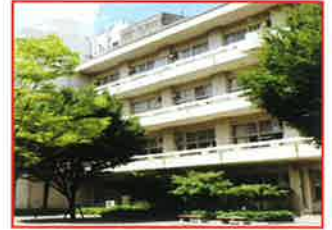
市立浦和高等学校