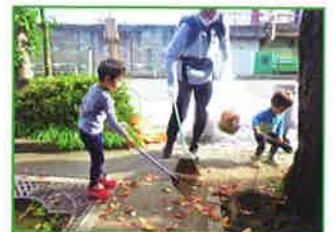
浦和区秋のごみゼロ運動