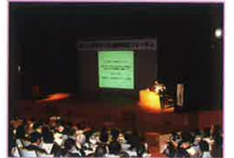
子ども虐待防止フォーラム

目標 子ども虐待防止フォーラム参加者のうち「参考になった」90%以上 市内におけるハローエンゼル訪問の実施率 95%以上