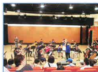
わくわく浦和区フェスティバル