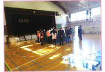
区避難所運営訓練