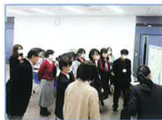
浦和ネクストステージプロジェクト

目標 アンケートで「浦和区の将来像やまちづくりについて考えるきっかけになった」と回答した参加者の割合 70%以上