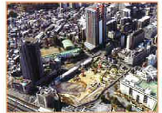
浦和駅西口南高砂地区市街地再開発事業