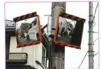
道路反射鏡の設置例

目標 道路照明施設(公衆街路灯)の設置数 600灯(市全域) 道路反射鏡の設置数 250基(市全域)