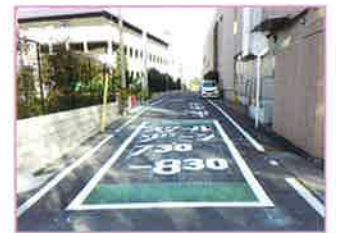
スクールゾーンの路面表示

目標 交通安全ワークブックの配布 区内を学区とする小学1年生 路面表示等の実施 区内の小学校4校