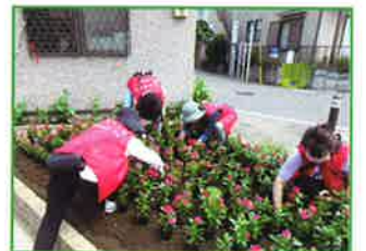
ニチニチソウの植栽活動

目標 イベントやSNSなどで区の花「ニチニチソウ」のPRを実施 アンケートによる認知度 50%以上