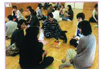
子育て応援サロン