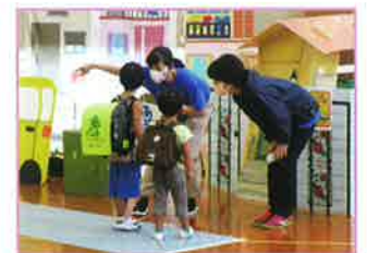
浦和区親子防犯教室

目標 講演会・教室あわせて、アンケートで「防犯意識が向上した」90%以上 特殊詐欺防止啓発活動対象者数 1,000人