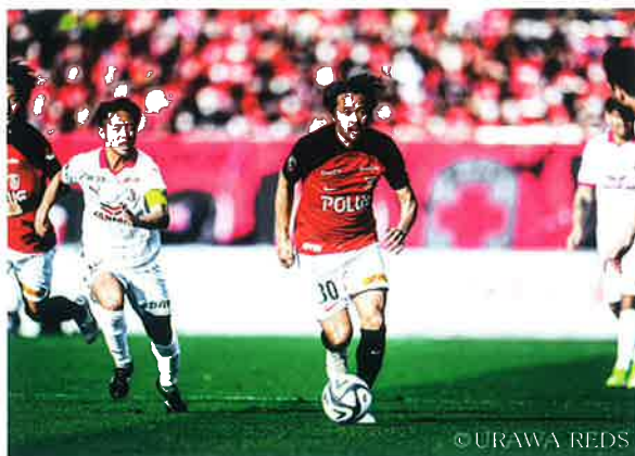
浦和駒場スタジアムで戦う浦和レッズ