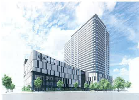
浦和駅西口南高砂地区市街地再開発事業（完成後イメージ）