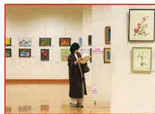
浦和区絵画作品展