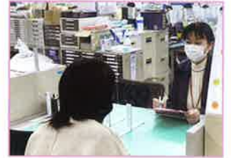
福祉まるごと相談窓口