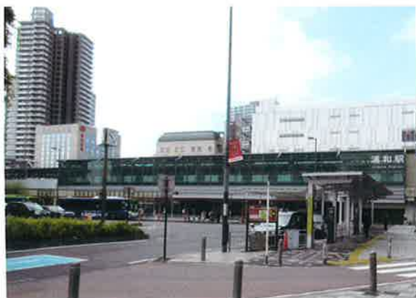
祝 浦和駅開業 140周年