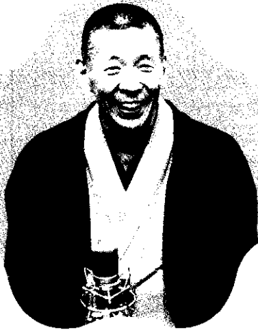
りゅうてい いちば 柳亭 市馬