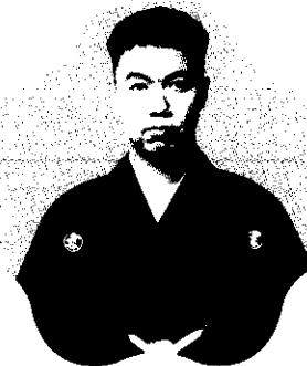
たてかわ きっしょう 立川 吉笑

1995年 三代目三遊亭團歌に入門 前座名「歌さち」 1999年 ニツ目昇進 「歌彦」と改名 2008年 真打昇進 四代目「歌奴」を襲名 2010年 平成21年彩の国落語大賞 受賞