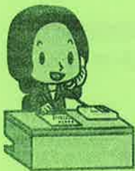
さいたま市消費生活総合センター マスコットキャラクター 相談員さん