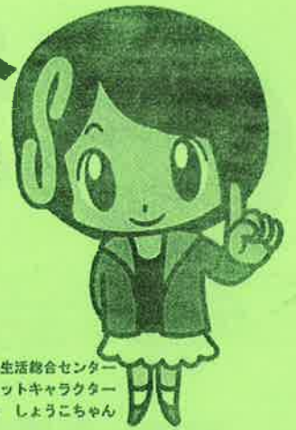
さいたま市消費生活総合センター マスコットキャラクター さいたま しょうこちゃん

消費生活センターでは、商品やサービスの契約トラブルなど、消費生活に関する相談を受け付け、消費生活相談員が相談者の皆さんと共に考え、解決に向けてお手伝いします。