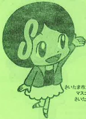
さいたま市消費生活総合センター マスコットキャラクター さいたま しょうこちゃん