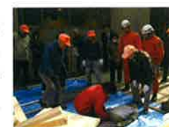
みんなで考えると防災意識が高まっていくな!

減災都市づくりの重点的な取り組みの一つとして、火災延焼等による被害が広範囲に及ぶ地区において、「まち歩き」や「ワークショップ」等を通じて、地域住民の防災意識を向上させるとともに、それぞれの地区特性に応じた「地区防災まちづくり計画」を策定することで、地域住民が主体的に継続できる「防災まちづくり」を推進します。