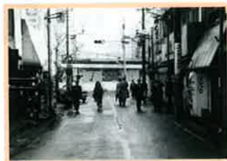
一見すると、ずいぶん昔の写真のようですが、実は1992年に撮影されたもの。ここ20年あまりで、通りは大きく変わりました。