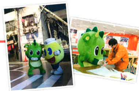
などと、誌面では他にも詳しく紹介しています!ぜひ、ご覧ください。

「東京臨海広域防災公園」の中にある防災体験学習施設「そなエリア東京」での体験を通じて、2人はたくさんのことを学びました。災害に備えて両市で行っている取り組みを交えながら、ヌウと川丸くんが報告します。