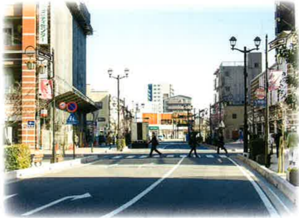
▲与野西口駅前通り

与野駅西口では、土地区画整理事業の進捗にあわせ、地元商店街と協力して景観にも配慮した街路灯の整備を行うなど、駅前にはふさわしいまちづくりを行っています。