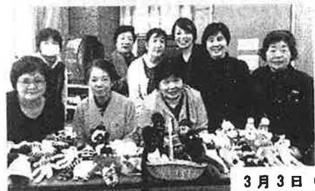
3月3日（木） 「3.11を忘れない被災地の現在（いま）」報告会