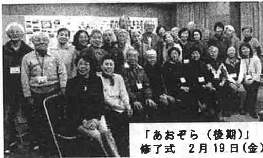
「あおぞら（後期）」 修了式 2月19日（金）