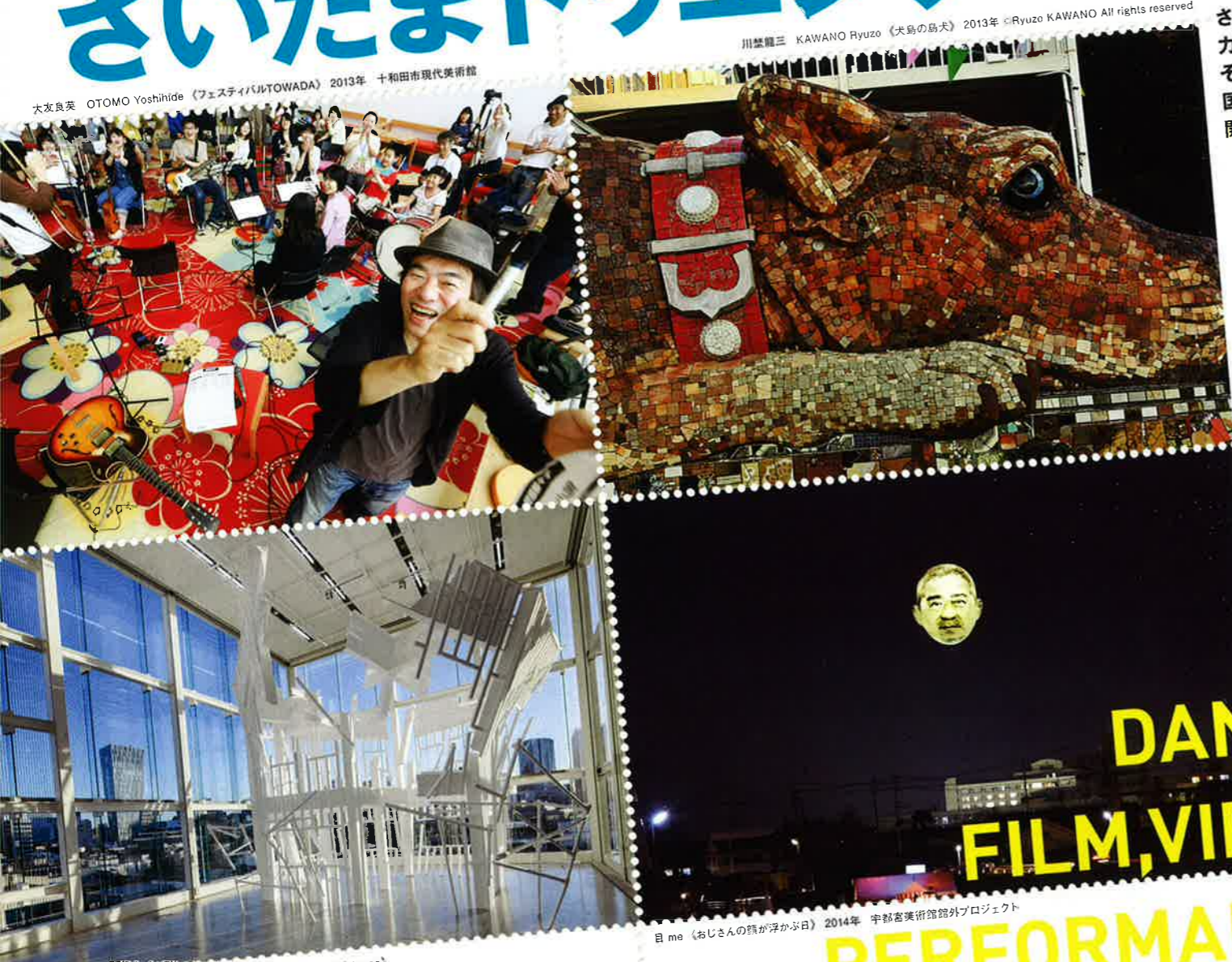
川島龍三 KAWANO Ryuzo 《犬島の島犬》2013年