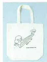
※先着順につき、なくなった場合はご了承ください。