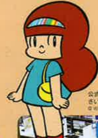
会誌イメージキャラクター さいたまママアソシエーション © WAKA FODINAMI

さいたまで初めての国際芸術祭。世界のアートをさいたまのまちなかで発見し、楽しむ79日間が始まります。鑑賞は無料（一部の公演、上映を除く）、会期中何度でもお楽しみいただけます。