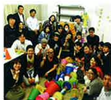
毎週行なわれている「さいたまアーツステーション」のサポーターズ・ミーティングの様子 (アーティストのチェックインさん)

*本芸術祭及び関連イベント・サポーター活動における記録写真・映像は、さいたまトリエンナーレ2016、およびさいたま市の活動として、ウェブサイトやチラシ、カタログ、報告書などに使用することがあります。ご了承のうえご参加ください。