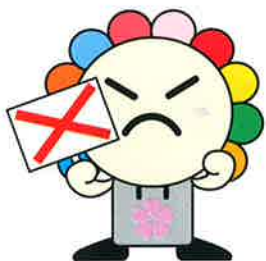
さいたま市選挙キャラクター みらいくん